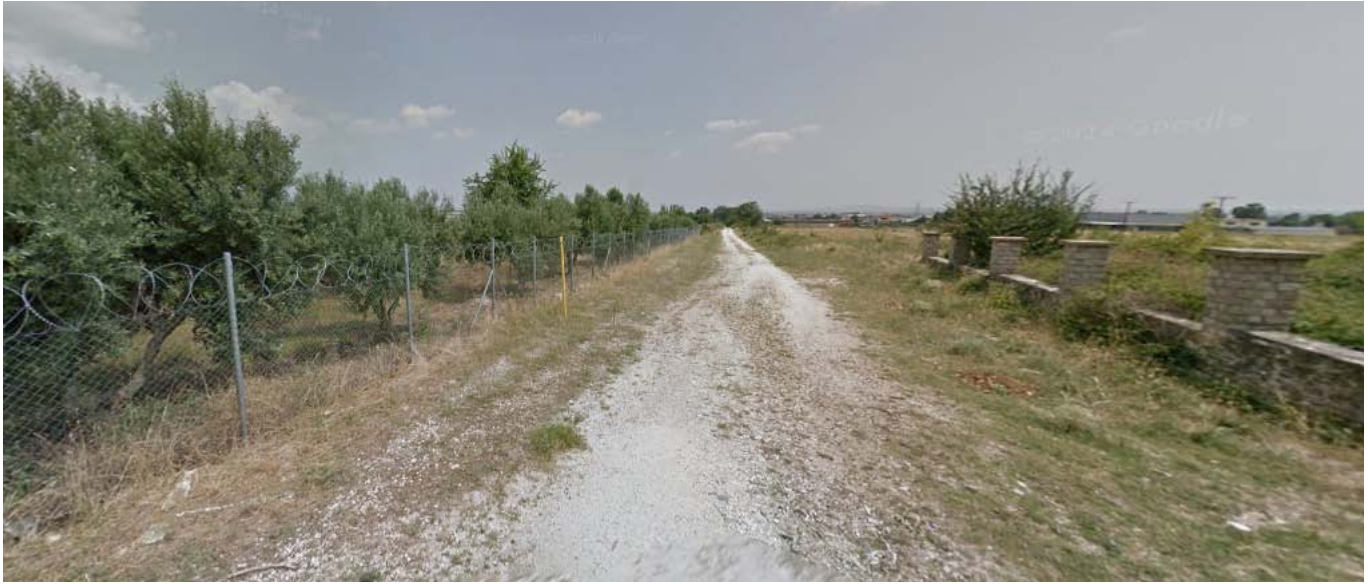
Εικόνα 5: Ορατότητα από είσοδο-έξοδο προς συμβολή με άλλη ανώνυμη οδό