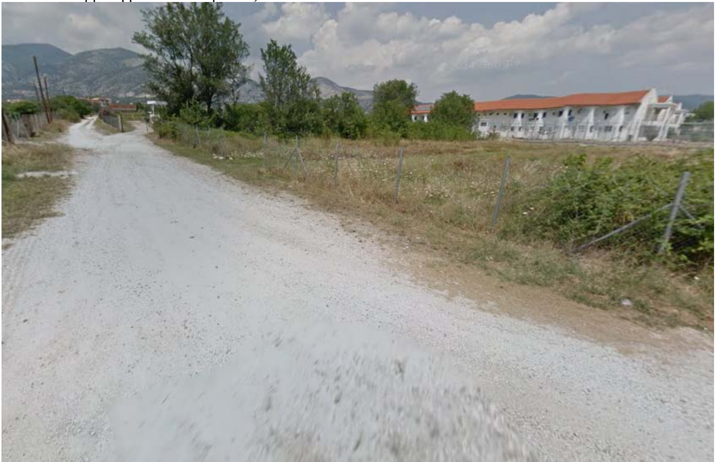
Εικόνα 4: Ορατότητα από συμβολή με άλλη ανώνυμη οδό