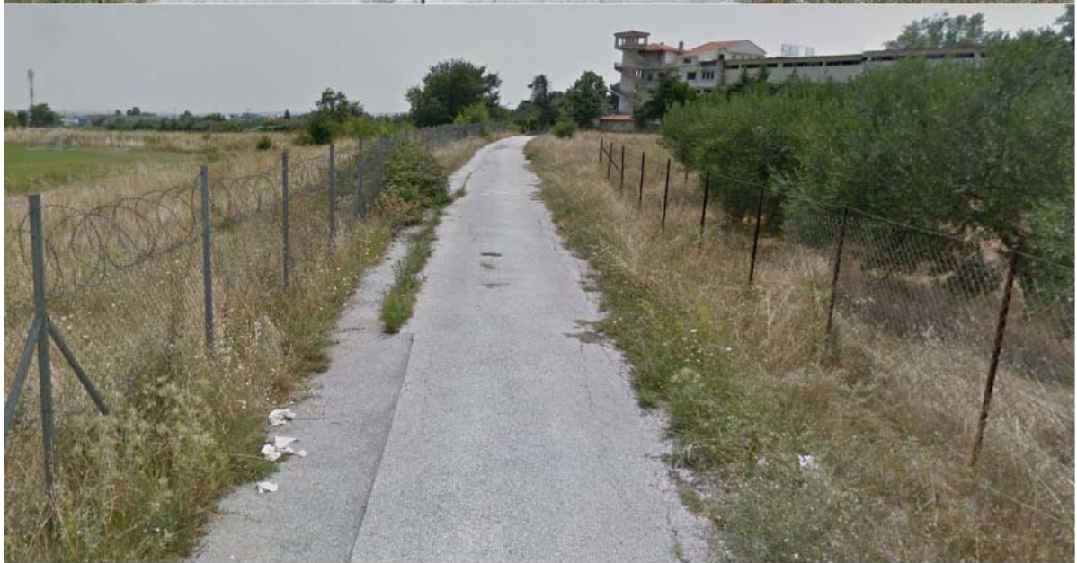
Εικόνα 6: Όδευση τμήματος μεταξύ εισόδου-εξόδου και Ιπποκράτους