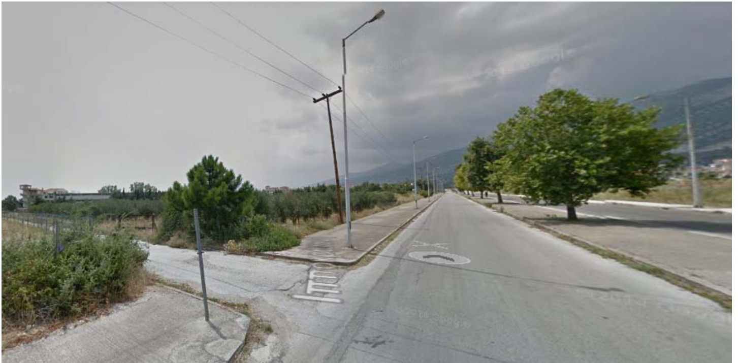
Εικόνα 3: Συμβολή με οδό Ιπποκράτους