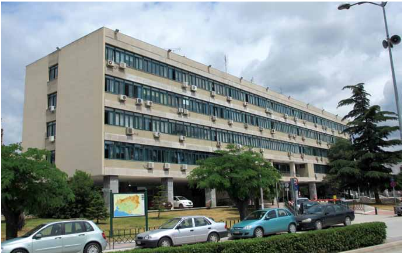
Διοικητήριο - Κομοτηνή