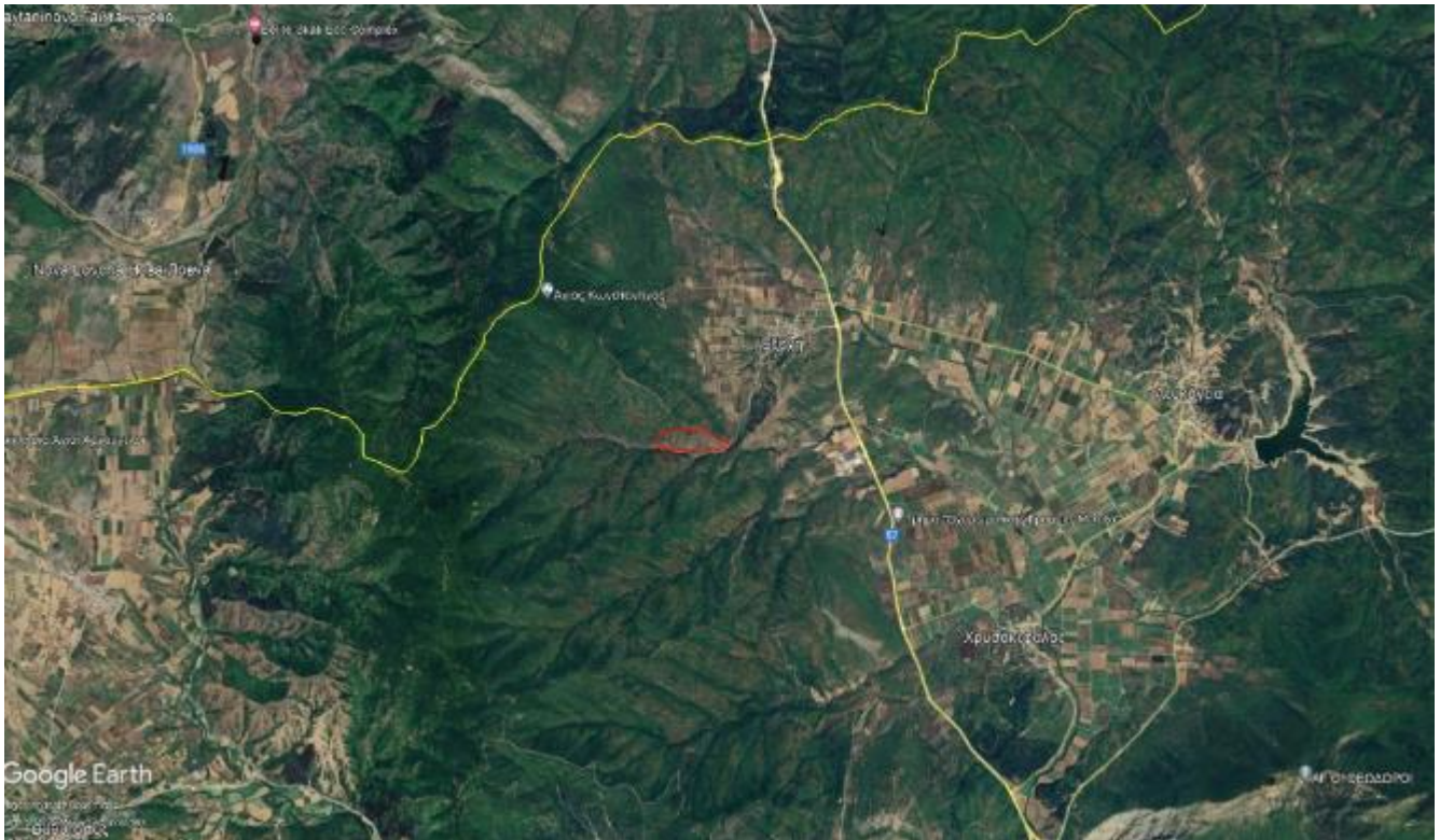
Φωτογραφία ευρύτερης περιοχής.