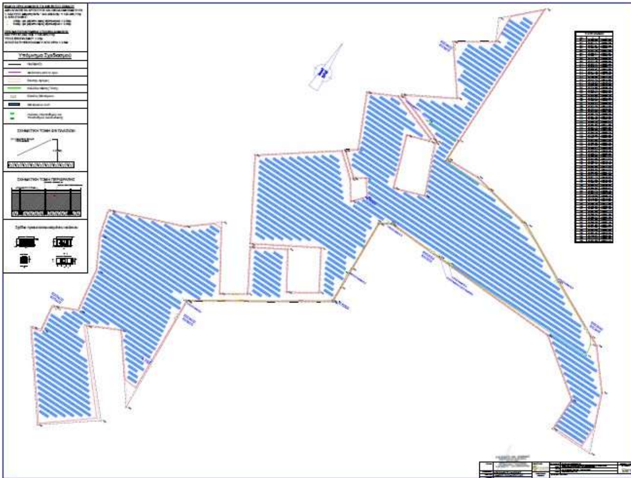
Η περιοχή κάλυψης του συνολικού γηπέδου από Φ/Β πλαίσια και τους υποσταθμούς.

Αναφορικά με την κάλυψη των εγκαταστάσεων σε σχέση με την έκταση του γηπέδου που θα εγκατασταθείτο φωτοβολταϊκό πάρκο ισχύουν τα κάτωθι: