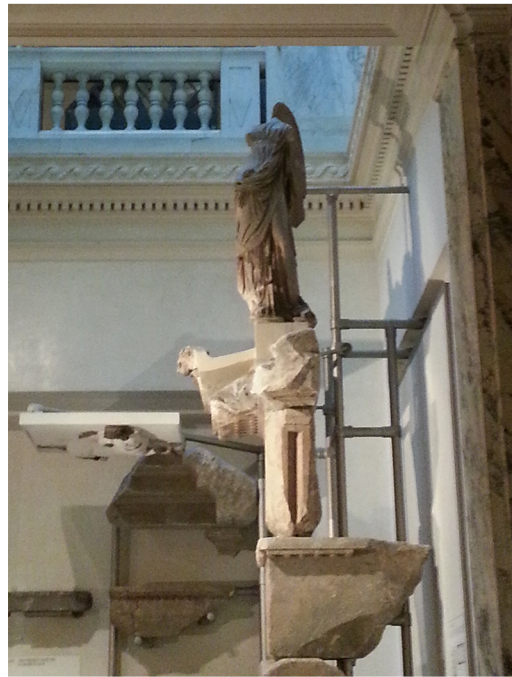
Η Νίκη που εκτίθεται στο Kunsthistorisches Museum της Βιέννης