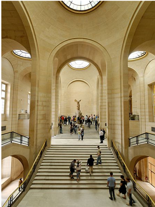
Η Νίκη που εκτίθεται στο Μουσείο του Λούβρου στο Παρίσι

Η Νίκη της Σαμοθράκης αποτελεί μία από τις τρεις φτερωτές Νίκες που βρέθηκαν στο Ιερό των Μεγάλων Θεών της Σαμοθράκης.