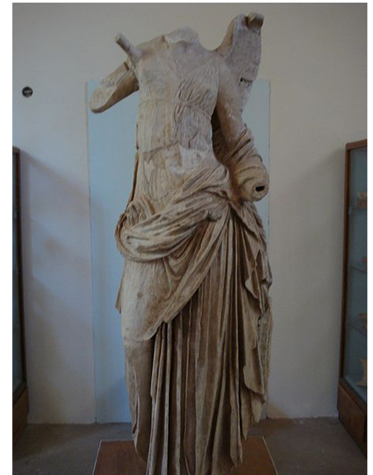
Η Νίκη που εκτίθεται στο Αρχαιολογικό Μουσείο της Σαμοθράκης