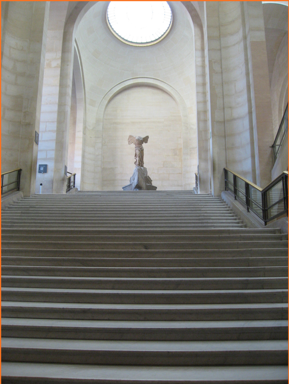
Η Νίκη της Σαμοθράκης στο Λούβρο