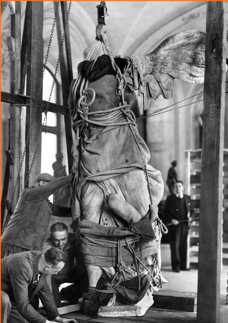
Εργασίες απομάκρυνσης της Νίκης της Σαμοθράκης από το Λούβρο κατά το Β' παγκόσμιο πόλεμο