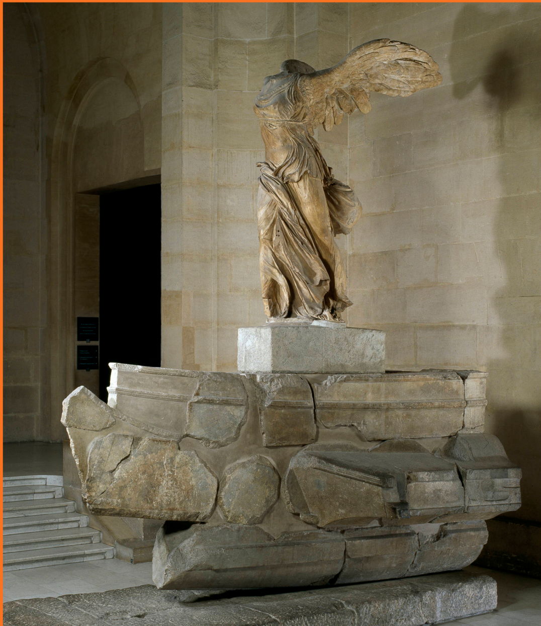
Η Νίκη της Σαμοθράκης στο Λούβρο