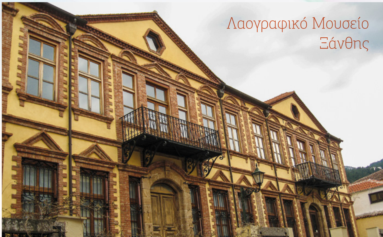
Λαογραφικό Μουσείο Ξάνθης